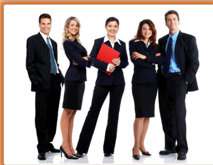
การแต่งกายแบบสากล

แม้ว่าในหลายประเทศจะมีเครื่องแต่งกายที่เป็นชุดประจำชาติซึ่งมีเอกลักษณ์ที่แตกต่างกันไป แต่ก็ยังมีการแต่งกายที่คนในสังคมส่วนใหญ่ให้การยอมรับว่าเป็นการแต่งกายสากล อีกทั้งยังรับเอาวัฒนธรรมการแต่งกายสากลนี้มาใช้ในชีวิตประจำวันอย่างแพร่หลายซึ่งสามารถพบเห็นได้โดยทั่วไป เครื่องแต่งกายสากล เช่น เสื้อสูท เนกไท เสื้อเชิ้ต รองเท้าหุ้มส้น เป็นต้น