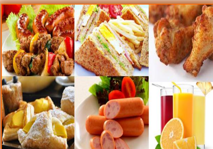
อาหารฟาสต์ฟู้ด

วัฒนธรรมสากลหลายประเภทเป็นวัฒนธรรมที่ไม่เหมาะสมกับสังคมไทย เช่น การรับประทานอาหารแบบอาหารจานด่วนหรือฟาสต์ฟู้ดของชาวตะวันตก ซึ่งเป็นอาหารที่ไม่มีคุณค่าทางอาหารและมีสารอาหารน้อยมากซ้ำยังมีราคาแพงกว่าอาหารไทยทั่วไป ซึ่งมีคุณค่าทางอาหารสูงกว่า ดังนั้นเราจึงควรเลือกรับประทานอาหารไทยดีกว่า